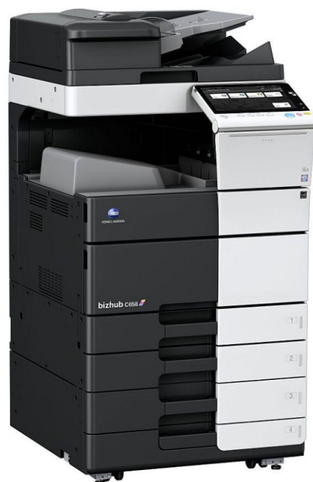
Imaginea este cu titlu de prezentare